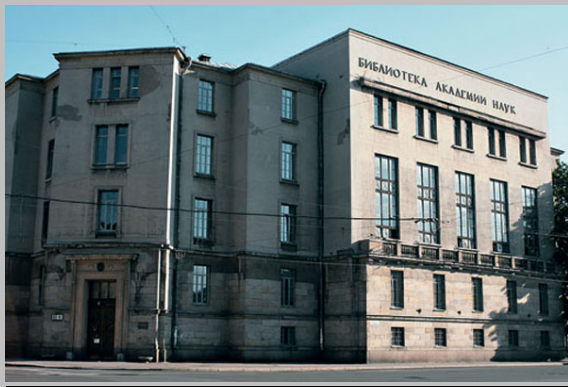
Библиотека Академии наук- Петра 1

6. Указ об учреждении этой должности для своего книжного собрания первой из российских монархов подписала Екатерина Великая. Какой именно? Ответ: Библиотекарь